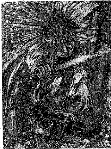
Case 244 Fig. 167, The Avenging Angel (Crayton). 24 x 40 cm.

Frontispiz der Ausgabe „Hans Prinzhorn: Artistry of the Mentally Ill“ Springer Verlag Berlin, Heidelberg, New York 1972