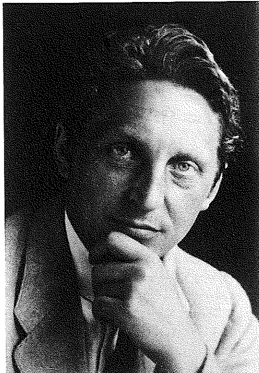
Hans Prinzhorn (1886-1933) Fotografie um 1925

eigene Erfahrungen mit künstlerischer Gestaltung. Sein Interesse an Anstaltskunst lässt sich wie seine Analysemethoden zurückverfolgen auf psychologisch orientierte Strömungen in der Kunstwissenschaft und Philosophie, denen er während seines Studiums in Tübingen, Leipzig und München zwischen 1904 und 1909 begegnet war (insbesondere bei August Schmarsow und Theodor Lipps).