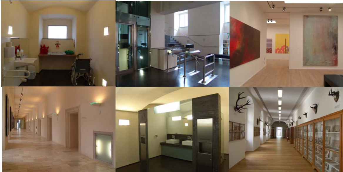
Bildbeispiele: Toiletten, Lift mit Blindenschrift, Rampen statt Treppen, keine Hindernisse etc.

Das Jahresthema lautet: Ich fühle was, was du nicht siehst. Kunst zum Begreifen.