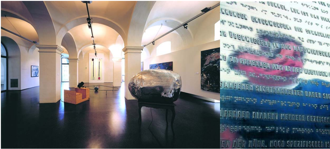
Werner Reiterer, Ohne Titel, Made for Admont 2002/2003

Diese Skulptur ist interaktiv erfahrbar. Sie sieht aus wie ein auf einem Möbel gelandetes UFO, das Yellow Submarine der Beatles oder etwas in der Art. Seine unerwarteten Eigenschaften werden in jenem Moment hörbar, sichtbar, spürbar, in dem man das Objekt mittels Knopf- und Zugmechanismen aktiviert: Stimmen, Blitze, das in den vier Ecken des Raumes erklingende Echolot eines U-Bootes!