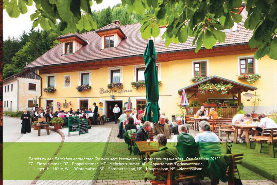
Details zu den Betrieben entnehmen Sie bitte dem Vermieter- u. Veranstaltungskatalog „Das Gesäuse 2012“ EZ - Einzelzimmer, DZ - Doppelzimmer, MZ - Mehrbettzimmer, AP - Appartement/Ferienwohnung, L - Lager, H - Hütte, WI - Wintersaison, SO - Sommersaison, HS - Hauptsaison, NS - Nebensaison