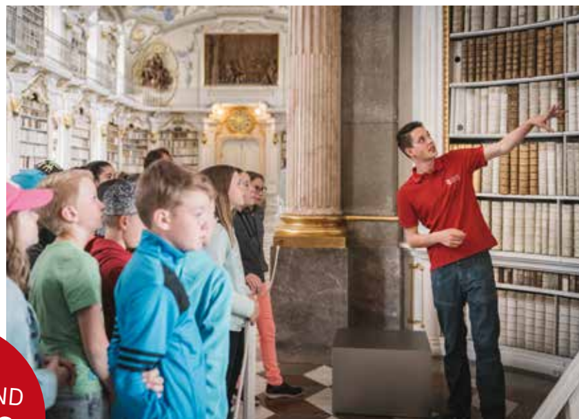
Junge Gäste in der Stiftsbibliothek