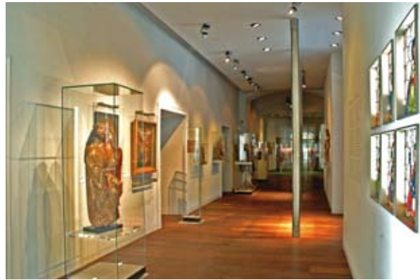
Kunsthistorisches Museum – Fine art museum