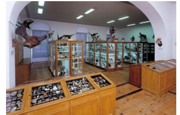
Naturhistorisches Museum – Natural history museum