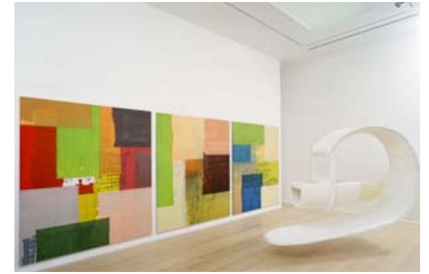
Museum für Gegenwartskunst – Museum of contemporary art