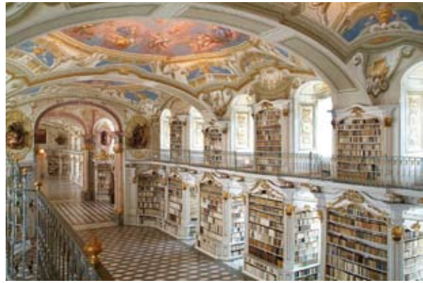
Weltgrößte Klosterbibliothek – Largest monastery library